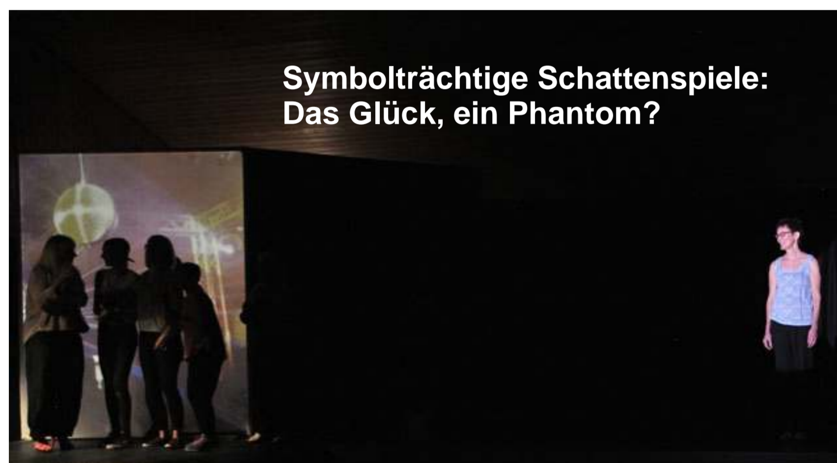
Symbolträchtige Schattenspiele: Das Glück, ein Phantom?