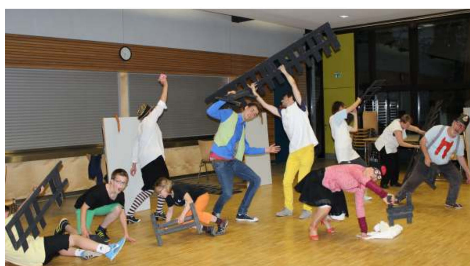
Probe und Aufführung: Die Tumultszene

„Komisch in seiner Über- zeichnung zeigt das Stück auf grotesk-bizarre Art, wie die einen sich von Heils- versprechungen verführen lassen und die anderen daraus zu profitieren suchen.“ Reutlinger General- Anzeiger