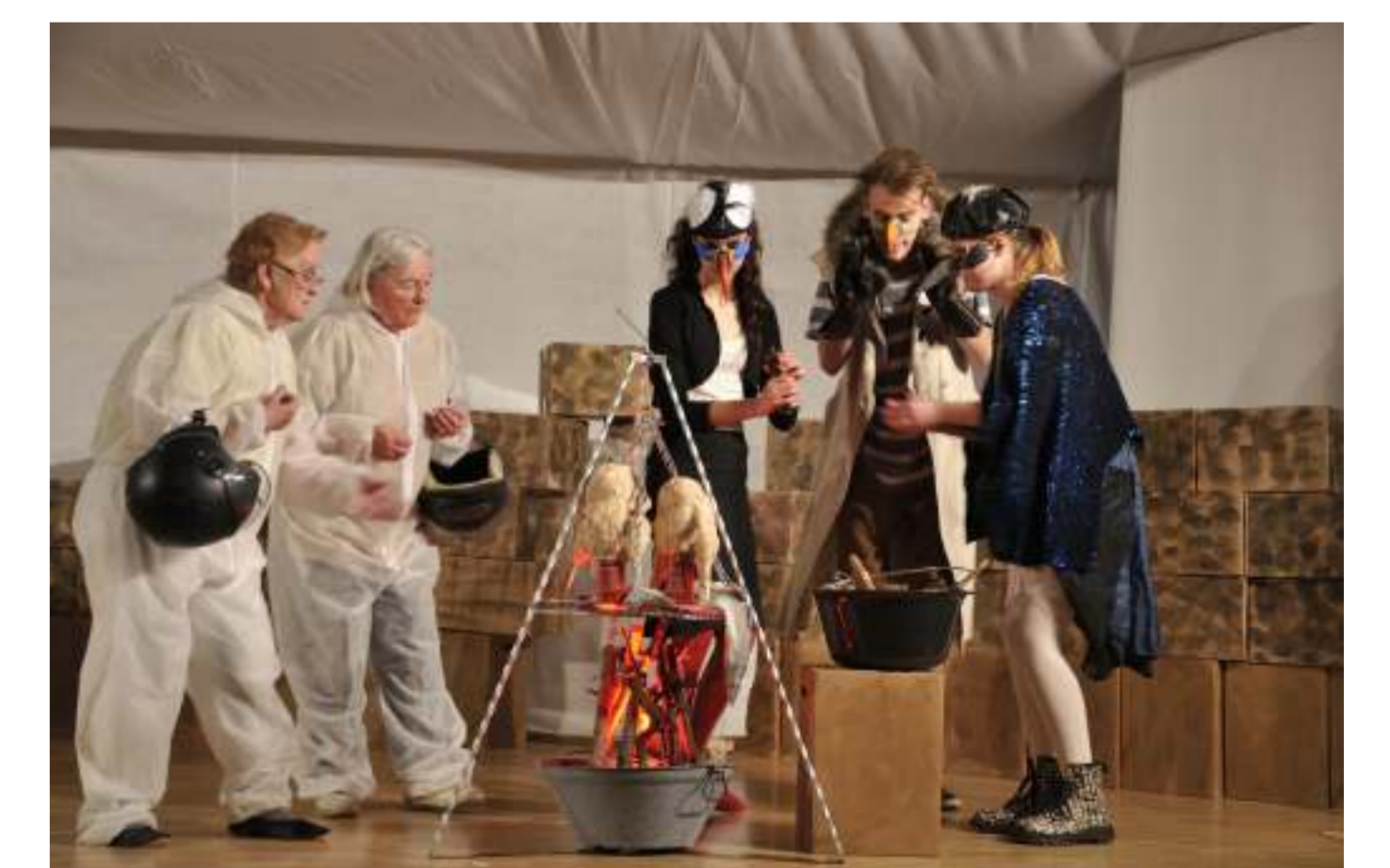
Zur Vorbereitung auf die Darstellung der Vögel hatte sich die Gruppe alle ornithologischen Werke aus der Stadtbücherei und CDs mit Vogelstimmen ausgeliehen. Nachdem die zum Stück passenden Arten gefunden waren, durften sich alle „ihren“ Vogel aussuchen.