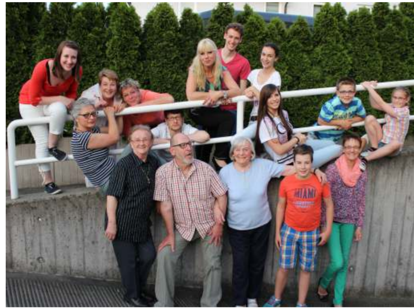
Das Ensemble 2013/14