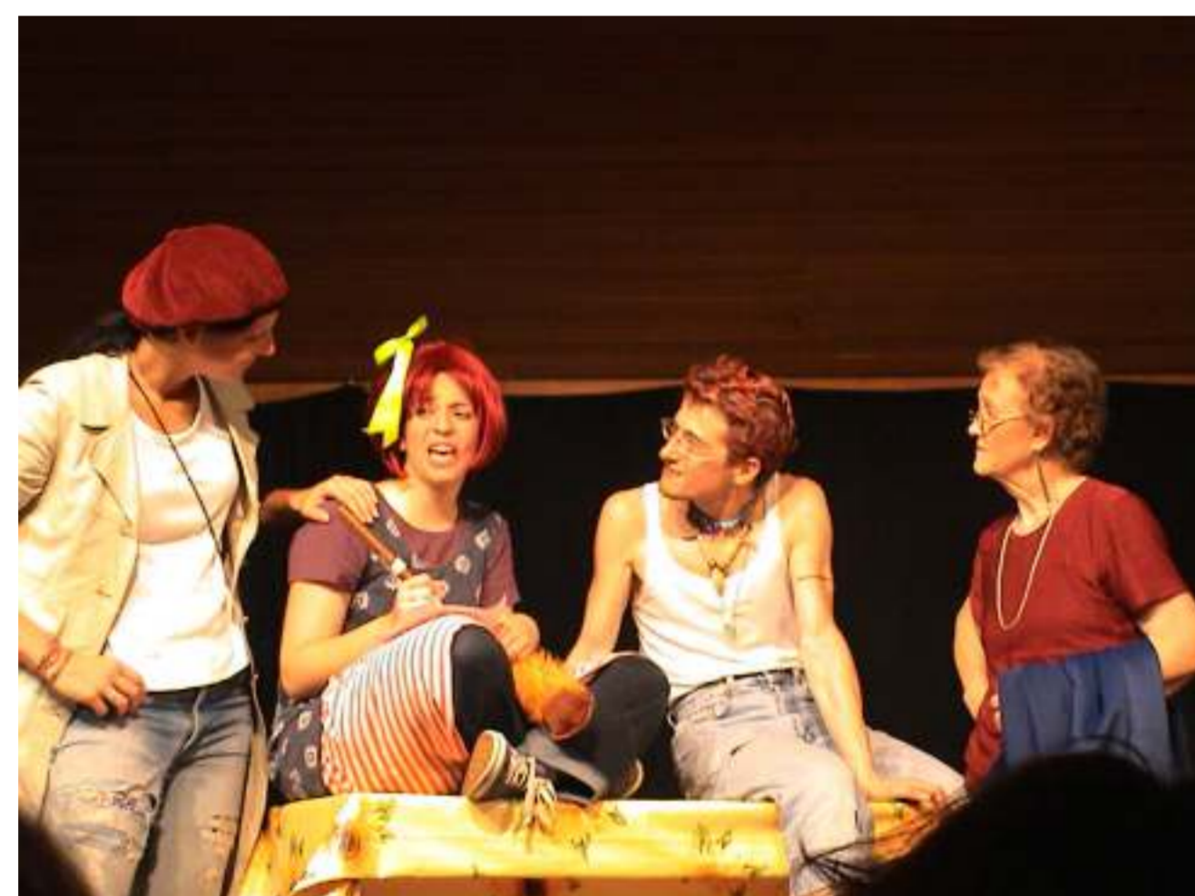
Lotta mit ihrer „Pflegefamilie“...