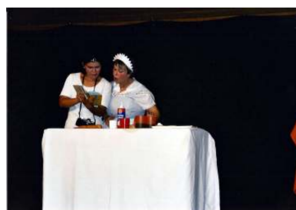
Chor der Hausmeisterinnen

„Kurzweilig, amüsant und anspruchsvoll“ Reutlinger Generalanzeiger