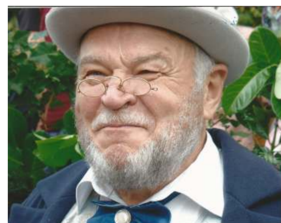
... beim Festumzug im Jahr 2006